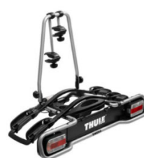
"Euroride 941" nosilec koles za kljuko - 2 kolesi