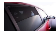
Senčniki za zadnji stranski okni in okno prtljažnega prostora