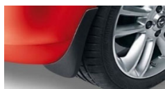
Zadnji zavesici proti blatu