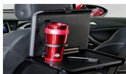
2 osnovni držali + 2 poklopni mizici