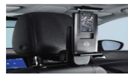
2 osnovni držali + 2 univerzalni držali za tabl. rač.