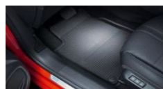
Tepihi za vse sezone