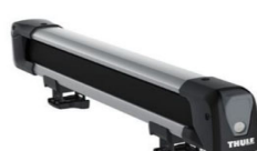
"Snowpack 7324" nosilec: 4 smuči / 2 snežni deski