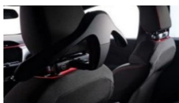
Osnovno držalo + obešalnik za jopič