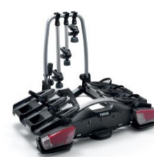
"Coach 276" nosilec koles za kljuko - 3 kolesa