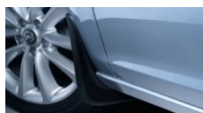
Prednji zavesici proti blatu