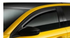
Usmernik zraka za sprednji okni