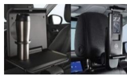
2 osnovni držali + 1 mizica + 1 držalo za tablični rač.