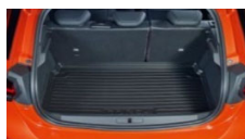
Protizdrsna podloga prtljažnika s privzdignjenim robom