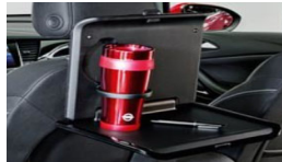
2 osnovni držali + 2 poklopni mizici