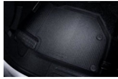
Tepihi za vse sezone