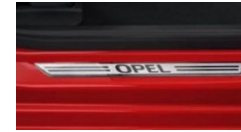
Opel letvice iz jekla, za prednji prag, izgled aluminija