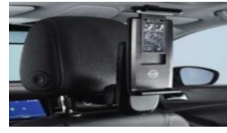
2 osnovni držali + 2 univerzalni držali za tabl. rač.