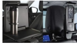
2 osnovni držali + 1 mizica + 1 držalo za tablični rač.