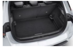
Gumijasta podloga za prtljažnik, dvostranska, vodotesna