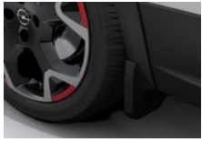
Prednji zavesici proti blatu