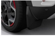
Zadnji zavesici proti blatu