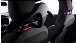
Osnovno držalo + obešalnik za jopič