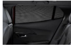
Senčniki za zadnji stranski okni in okno prtljažnega prostora