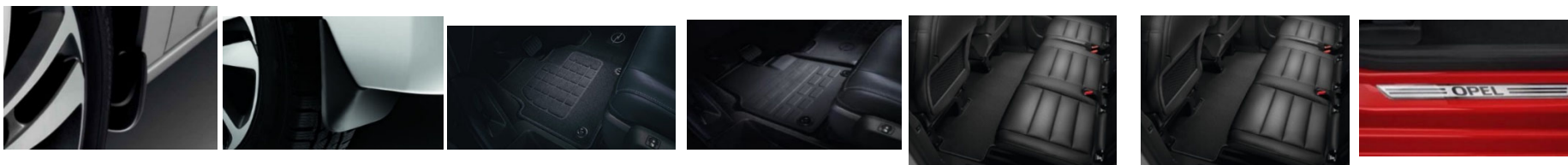
Prednji zavesici proti blatu