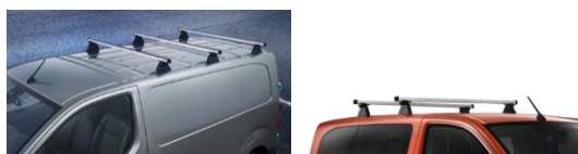
Prečni strešni aluminijasti nosilec, 1 kos (obremenitev z 2 palicami 100€, 3 palicami 150kg) 119 € / kos