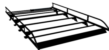
Jekleni prtljažnik L1 ( nosilnost 135 kg), L2 ( nosilnost 170 kg), L3 (nosilnost 170 kg) 1.085 € / 1.109 € / 1.175 €