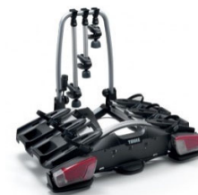
"Coach 276" nosilec koles za kljuko - 3 kolesa