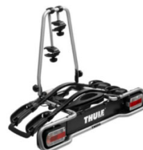
"Euroride 941" nosilec koles za kljuko - 2 kolesi