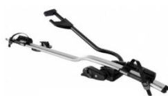
"Expert 298" nosilec za kolo, 1 kolo