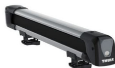
"Snowpack 7324" nosilec: 4 smuči / 2 snežni deski