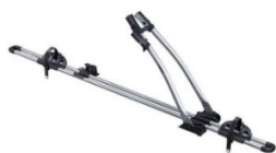
"Freeride 532" nosilec za kolo, 1 kolo