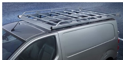
Aluminijasti prtljažnik L1 ( nosilnost 140 kg), L2 ( nosilnost 170 kg), L3 (nosilnost 170 kg) 1.285 € / 1.399 € / 1.475 €